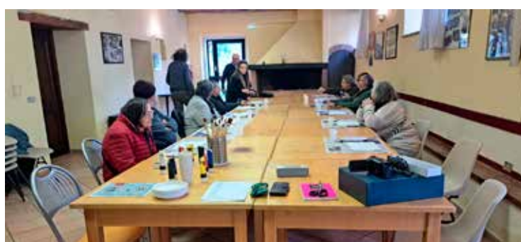
Momenti delle attività nella Casa di Accoglienza per anziani autosufficienti.

di arteterapia, mindfulness , poesia e musicoterapia recettiva. Tra gli obiettivi principali: la stimolazione delle funzioni cognitive, l'espressione emotiva, il rafforzamento dell'identità personale e la costruzione di relazioni significative tra ospiti, operatori e comunità locale. Il percorso si fonda su un approccio a orientamento umanistico-integrato, che considera il processo creativo come strumento di cura e relazione. Le attività comprendono pittura, disegno, scultura, modellazione in creta, collage, tecniche