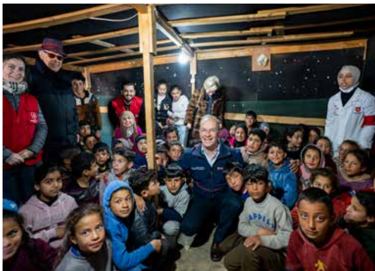
Il Grande Ospedaliere in un campo profughi nella Valle della Beqaa nel nord est del Libano.

E ne è valsa la pena. Perché da questa intervista a L'Orma emergono con chiarezza gli impegni caritativi e umanitari che il Sovrano Militare Ordine di San Giovanni di Gerusalemme, di Rodi e di Malta sta portando avanti nelle principali aree di crisi del