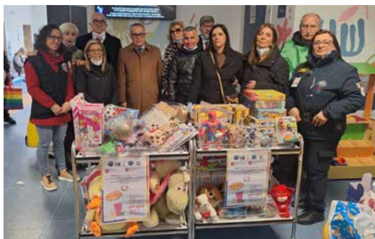
Il manifesto della Giornata del Giocattolo Donato e il gruppo dei volontari.