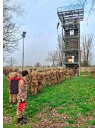
Alcuni momenti delle esercitazioni congiunte.

fine di garantire un servizio sempre migliore, più efficace ed efficiente. L'esperienza, che ora continua con ancor maggiore estensione temporale e territoriale, è stata autorizzata dalla Presidenza nazionale ACISMOM con il prescritto nulla osta dello Stato Maggiore E.I., in aderenza alla vigente Convenzione con lo Stato italiano. I risultati di tale attività sono stati particolarmente apprezzati dal Ministero della Difesa. Ma ciò che ha costituito il risultato "interno" migliore, per i componenti dell'Ordine di Malta, è stata certamente la positiva esperienza di "operare assieme" tra le diverse componenti dello SMOM. Massima sintonia e unità, insomma. Svolgendo tutti insieme un servizio delicato e utile, a sostegno del prossimo, che, in questo caso sono stati i militari dell'Esercito italiano Truppe Anfibie, brillantemente impegnati in moltissimi compiti per la difesa del nostro Paese e la sicurezza delle grandi città. ❧