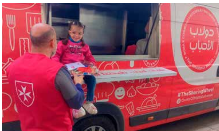
Una bambina sorride in una unità mobile dell'Ordine di Malta in Libano.