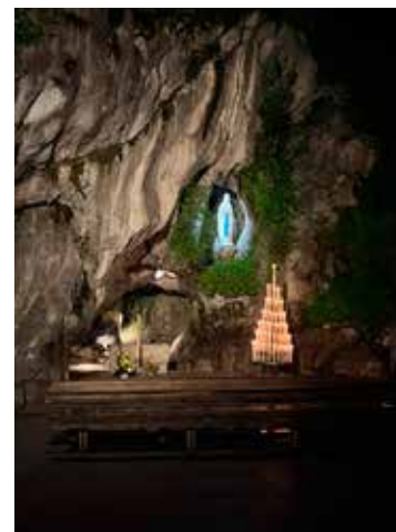
Vari momenti del Pellegrinaggio: il lancio dei palloncini rossi dalle balconate dell' Accueil , le istruzioni per l'uso delle voiture e delle carrozzine, l'affollatissima Messa nella Basilica San Pio X, la magia notturna della Grotta di Massabielle.