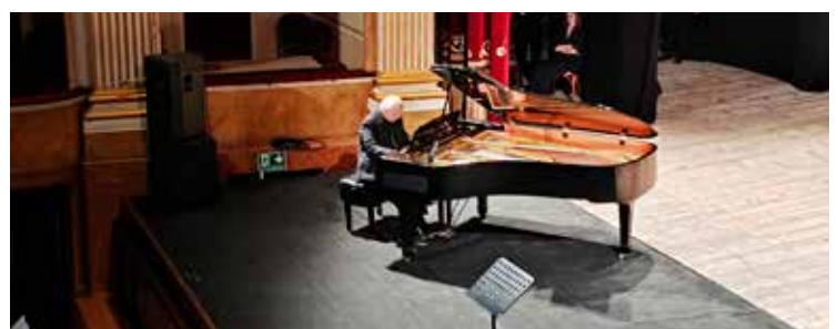
Il Cardinale Lorenzo Baldisseri al piano.