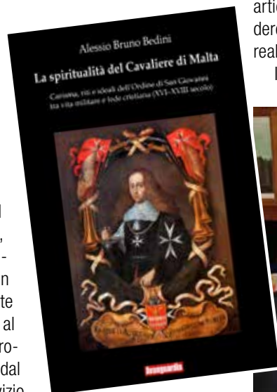
La copertina del libro e l'autore.

Si avverte, anzitutto, nell'Autore - dottore di ricerca in demografia storica e storia sociale presso l'Università Aldo Moro di Bari - e nello stile espositivo un notevole entusiasmo nell'evidenziare una serie di valori e di strumenti per il conseguimento degli stessi, quali emergono nel continuo aggiornamento regolamentario, volto alla formazione e alla coerenza della vita dei Frati-Cavalieri nei secoli presi in considerazione. E ben lo si comprende stante la vertiginosa altezza degli ideali congiunta al pratico e quotidiano mettere in gioco la propria stessa esistenza richiesta ai Cavalieri dal servizio nella Sacra Infermeria e dal servizio militare soprattutto nella Marina. Dopo una