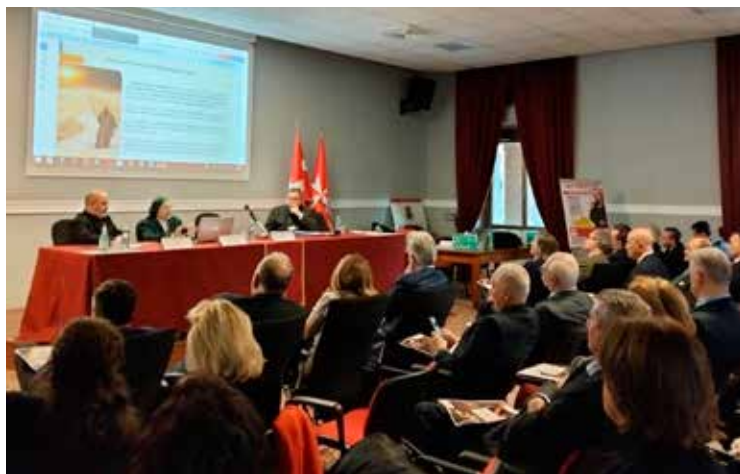
La sala durante i lavori.

* Cavaliere di Onore e Devozione in obb. Vice Delegato della Delegazione di Lombardia