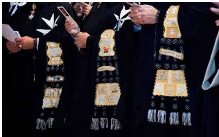
I "manipoli" o scapolari dei Cavalieri del Primo Ceto.