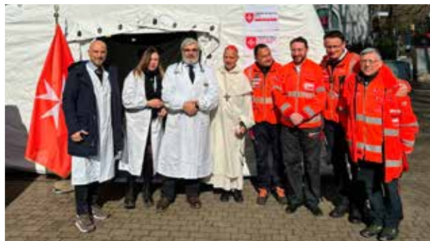
Uno screening medico gratuito e la visita del Cardinale Jean-Paul Vesco alla postazione congiunta gazebo/ambulanza.