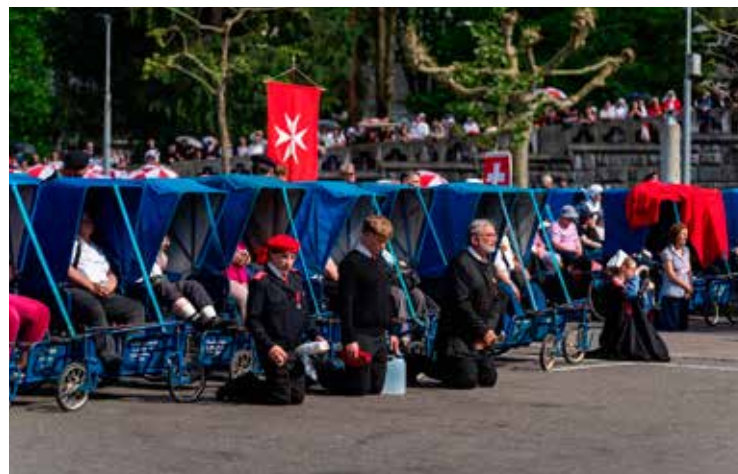
Un momento di preghiera al nostro ultimo Pellegrinaggio a Lourdes.