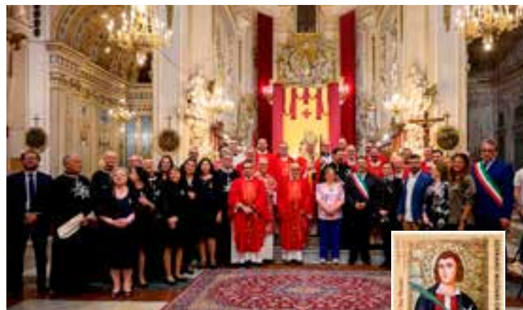
Foto di rito al termine della Santa Messa celebrata dall'Arcivescovo di Palermo mons. Corrado Lorefica. Il francobollo delle Poste Magistrali dell'Ordine di Malta celebrante San Nicasio.

Il culto del Martire Nicasio si diffuse fin da subito grazie ai suoi nobili parenti e allo zelo dell'Ordine di San Giovanni. La devozione si propagò soprattutto in