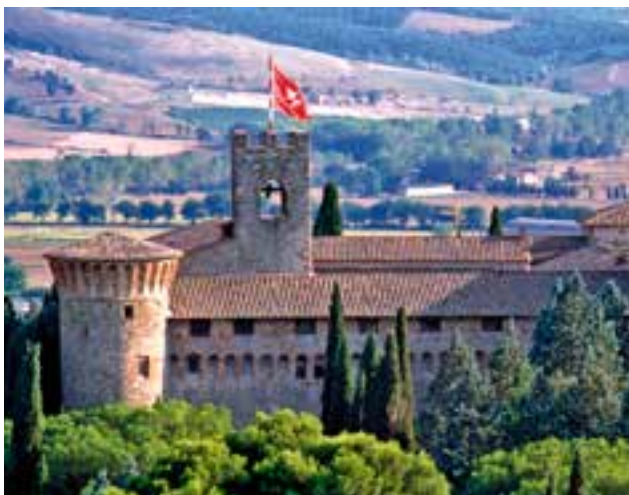
Un momento della presentazione. Veduta aerea del Castello di Magione, in provincia di Perugia, sede di una delle cantine e aziende agricole gestite dall'Ordine di Malta.

Giornata di allegria al quartiere romano Laurentino 38 organizzata dal centro Nando Peretti