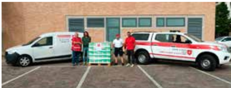
La consegna dei cartoni di latte pronti per la distribuzione.

Con tale spirito, la Delegazione ha posto in essere una collaborazione con il