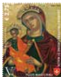
Il francobollo con l'icona della "Madonna di Costantinopoli" e il foglietto riprodotto la Rocca viterbese dell'Albornoz da una stampa dell'epoca.

Le Poste Magistrali dell'Ordine di Malta hanno emesso lo scorso maggio una serie di tre francobolli e un foglietto celebrativi del quinto centenario dello Stabilimento della sede dell'Ordine in Viterbo. Persa Rodi, per mano del Sultano Solimano