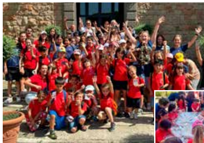
Una gioiosa foto del gruppo di adolescenti della parrocchia romana San Mauro Abate. I piccoli impegnati nel corso per impastare la pizza.

* Donato di Devozione Responsabile comunicazioni. Delegazione di Roma