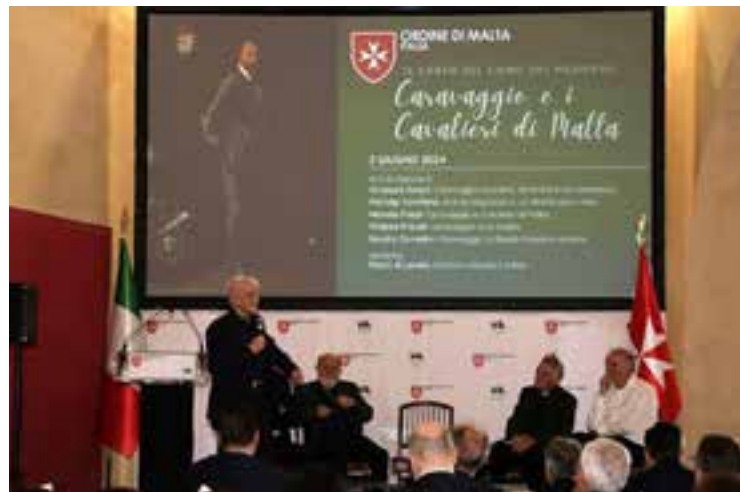
A sinistra, dopo il restauro, l' Ecce homo ritrovato e attribuito al Caravaggio. Qui sopra, un momento del convegno alla Casa dei Cavalieri di Rodi.

* Redattore delle pagine culturali del Corriere della Sera Docente universitario