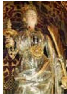
La statua argentea di Santa Lucia.

La locale Delegazione dell'Ordine di Malta è sempre invitata all'evento che vede spesso la presenza di illustri autorità ecclesiastiche. Quest'anno, per esempio, la Santa Messa è stata presieduta dal Cardinale Paolo Romeo, Arcivescovo emerito di Palermo e membro dell'Ordine. Vi hanno partecipato l'attuale Arcivescovo Monsignor Francesco