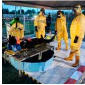
Momenti delle esercitazioni.

La supervisione del personale della Sanivet ha consentito il confronto su procedure e competenze che saranno oggetto di ulteriori attività addestrative nell'ambito dell'UT.