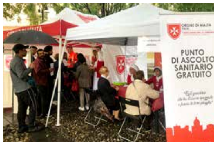
Il posto di primo ascolto medico e un'immagine dell'interno del gazebo con i medici volontari in attività.