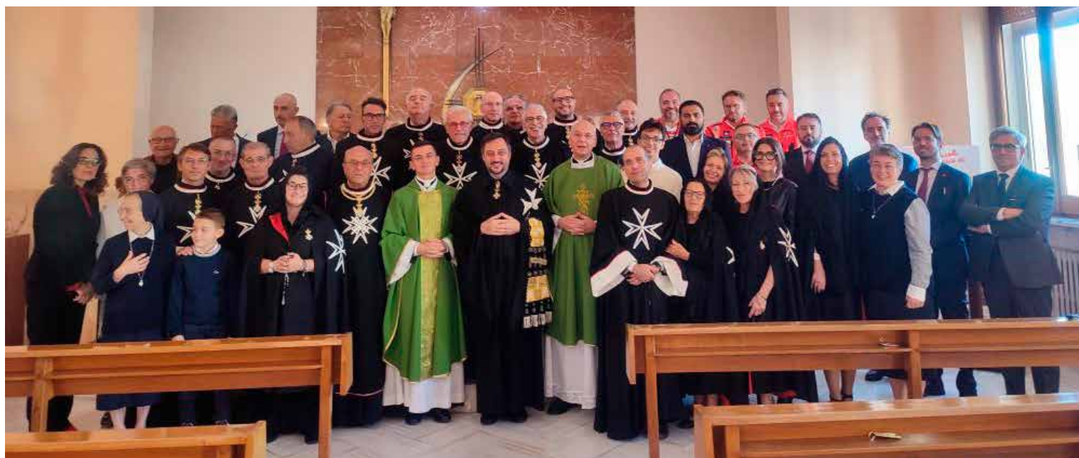
I partecipanti a un recente ritiro spirituale della Delegazione.

Cavaliere di Grazia Magistrale Centro Studi Melitensi - Taranto