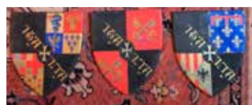
In alto, lo stemma del Gran Maestro Fra' John Dunlap e il suo seggio con la corona nella Chiesa dell'Ordine all'Aventino. Qui sopra, stemmi di alcuni Priorati e Associazioni.