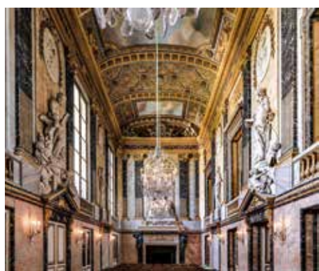
Opera Reale di Versailles.