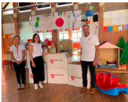
Pacchi dono alla scuola per l'infanzia Sant'Erminio (Perugia).

N on soltanto cibo e un tetto. Chi è nel bisogno necessita di tutto. Ecco quindi che le periodiche donazioni alla Delegazione umbra dell'Ordine di Malta da parte dell'azienda Risparmio Casa srl si rivelano davvero utili. Giocattoli, detersivi, pentole, biancheria per la casa, elettronica, oggettistica, e prodotti per l'igiene personale: sono alcuni dei beni che fanno parte delle donazioni della catena di negozi e che la delegazione umbra dell'Ordine di Malta provvede a ritirare, preparare e ridistribuire alle persone e famiglie in stato di necessità. «La collaborazione con Risparmio Casa Gest Srl è preziosa e fondamentale per portare avanti le attività caritative della Delegazione Umbria e rendere ancora più efficace l'azione del Gran Priorato di Roma sul territorio regionale» sottolinea Filippo Orsini, delegato dell'Ordine di Malta per l'Umbria. Recentemente hanno beneficiato di questa generosità i quindici monasteri regionali assistiti dall'Ordine, la scuola per l'Infanzia Paritaria Gesù Redentore, l'Istituto comprensivo Perugia 6 di Castel del Piano, la scuola per l'infanzia di Sant'Erminio (Perugia) e il Centro Diurno per disabili Il Pavone Comu-