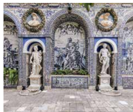
Palazzo de Fronteira a Lisbona.