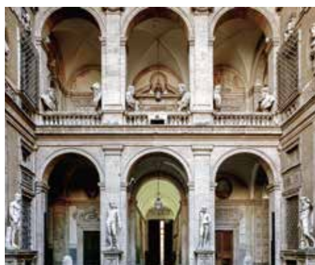
Roma, Palazzo Mattei.