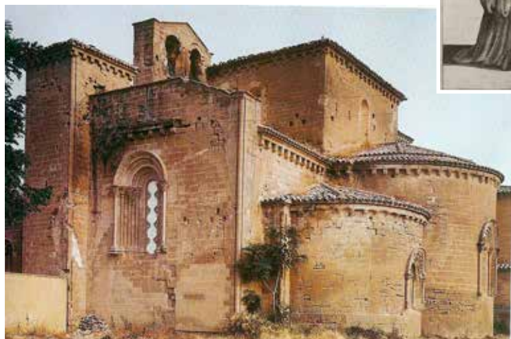
Qui sotto, due foto dell'imponente Monastero delle Suore melitensi di Sijena, fatto costruire nel XII secolo dalla Regina Sancha d'Aragona (al centro, in un disegno dell'epoca).