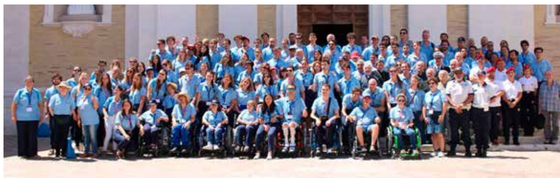
Foto di Gruppo del Campo estivo dell'anno scorso a Villa Ciccolini nelle Marche.

G iunge alla decima edizione il Campo Estivo Italia. Ormai una tradizione, avviata nel 1984 con il MaltaCamp, e che dal 2012 ha visto all'opera i tre Gran Priorati e poi ACISMOM e CISOM: tutti uniti nell'organizzazione di uno degli appuntamenti più importanti dell'esperienza melitense per i giovani. Dal 29 luglio al 3 agosto quasi centocinquanta fra volontari e assistiti si riuniranno a Villa d'Ayala a Valva (SA) per passare sei giorni di vacanza, condivisione e preghiera. Durante il Campo Estivo il carisma dell'Ordine - articolato nel binomio Tuitio fidei et Obsequium Pauperum - si manifesta in una dimensione particolare, concepita per lo svago e la spiritualità dei giovani nel periodo delle vacanze estive. Ogni ospite del Campo, chiamato "guest", avrà un "helper" suo coetaneo che lo seguirà e lo aiuterà nelle attività quotidiane, nel tentativo di ridurre il peso delle distanze imposte dalle disabilità. Anche quest'anno, come nei precedenti, si è scelto un tema tratto da passi della Bibbia - "Le tue mani mi hanno fatto e plasmato" (Salmo 119:73) - con il quale Padre Leszek Ruben Pys (C.Ss.R) e gli altri assistenti spirituali guideranno la catechesi e i momenti di spiritualità. Tutto questo è stato possibile grazie ai tre Gran Priorati e alle Delegazioni,