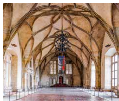
Castello di Praga.