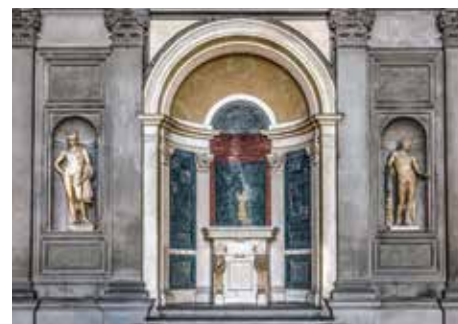
Firenze, Palazzo Vecchio.