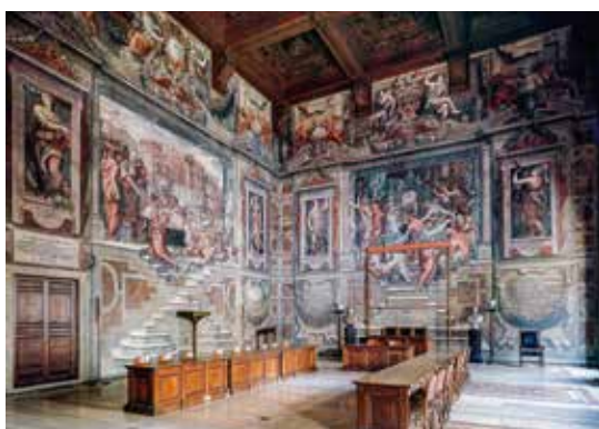
Roma, Palazzo della Cancelleria.