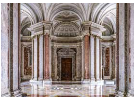
Reggia di Caserta.