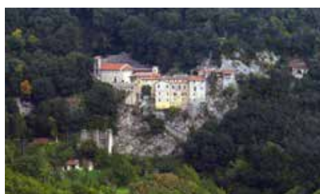
Alcuni volontari con due frati francescani del Santuario di Greccio. L'eremo del XIII secolo, in mezzo di boschi, fotografato dal paese.

Greccio, nei fine settimana di dicembre e durante la solennità dell'Epifania è una conferma dell'impegno e della dedizione dei Volontari dell'Ordine di Malta verso il prossimo.