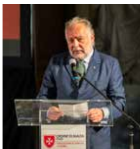
L'intervento del Procuratore Bernardo Gambaro.

*Gran Croce di Onore e Devozione in obbedienza Delegato alle Comunicazioni del Gran Priorato di Lombardia e Venezia