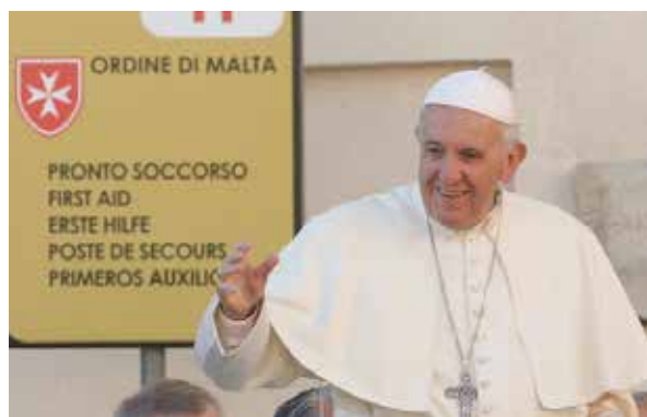
Il Papa davanti al posto di Primo Soccorso dell'Ordine di Malta in Piazza San Pietro.

San Pietro, San Giovanni in Laterano, Santa Maria Maggiore e San Paolo fuori le Mura. Sono le quattro Basiliche vaticane a Roma dove, su richiesta della Santa Sede, le squadre sanitarie dell'Ordine di Malta presteranno il loro servizio durante tutto l'Anno Giubilare 2025. Lo avevamo già fatto nei precedenti Giubilei, l'ultimo quello della Misericordia del 2016. L'impegno consisterà, in primo luogo, nel garantire 32 volontari al giorno in servizio per 386 giorni (qualcuno di più dell'anno solare) così coprendo 12.352 turni di servizio