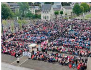
I pellegrini dell'Ordine schierati con i Signori Ammalati nel grande spiazzo davanti alla Basilica. Il Gran Maestro, Fra' John Dunlap, in affettuosa conversazione con un Assistito.

A Lourdes siamo tornati ai numeri pre Covid. Al 66esimo pellegrinaggio del nostro Ordine alla Grotta di Massabielle, dal 3 al 7 maggio, guidato per la seconda volta dalla sua elezione dal Gran Maestro Fra' John Dunlap, hanno partecipato circa settemila cavalieri, dame, volontari, e Signori Ammalati. Sono arrivati da 46 paesi: dall'Estremo Oriente (in particolare Hong Kong, Filippine, Nuova Zelanda e Australia), al Sudamerica; dall'Iraq a varie nazioni africane; da tutti i paesi europei, tra cui l'Ucraina e compresi, per la prima volta i tre Paesi baltici (Estonia, Lettonia e Lituania) più Svezia e Finlandia che pure affacciano sul Mar Baltico. I gruppi più numerosi sono stati quelli francese e italiano