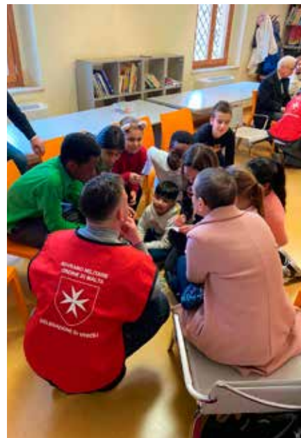
Tutti in cerchio a parlare e ascoltare.

Responsabile comunicazioni Delegazione di Veroli