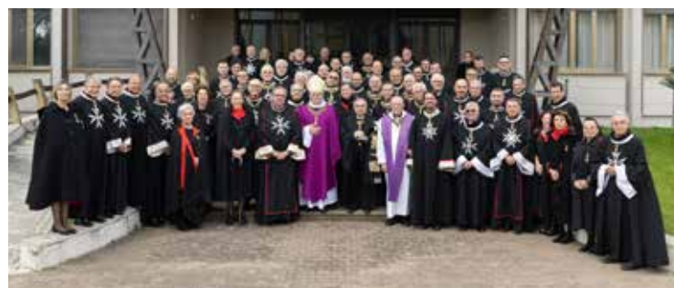
Foto di gruppo al termine degli Esercizi.

* Gran Croce di Onore e Devozione in Obbedienza Delegato per le comunicazioni del Gran Priorato di Roma