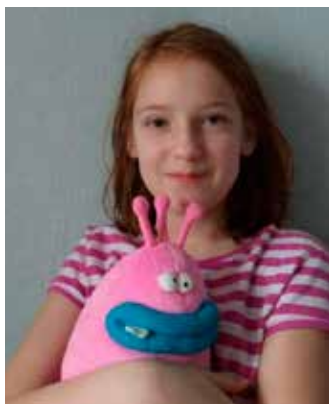
Il peluche italiano ha una nuova casa e una nuova compagna di giochi a Leopoli, in Ucraina.