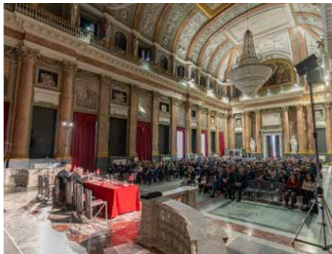
La sala del Maggior Consiglio gremita di membri e volontari.