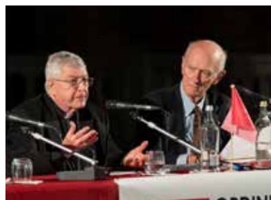
Un momento della relazione tenuta dal Cardinal Gianfranco Ghirlanda, Patrono dell'Ordine.