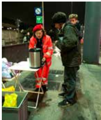
Sono tanti, troppi, i ragazzi tossicodipendenti che affollano il “boschetto”. Ma si stringono anche attorno ai nostri volontari. E colpisce la loro gentilezza e timidezza. Come a chiedere scusa...

I volontari delle unità di strada ogni mercoledì partono dalla sede milanese in direzione di quella che è diventata la piazza di spaccio di stupefacenti più tristemente nota di tutto il Nord Italia: il “boschetto” di Rogoredo, appunto. In dotazione portano: cibo, bevande calde, coperte, vestiario e una grande predisposizione all'ascolto. Con un importante obiettivo: agganciare i ragazzi, molti giovanissimi, che entrano ed escono da quel bosco e spiegare loro che un'alternativa è possibile. «Quando li avviciniamo quello che colpisce è la timidezza, la gentilezza con la quale accettano quello che abbiamo da offrire, che sia del cibo o una tazza di tè. Come se provassero vergogna, o peggio rimorso. È un momento fondamentale, questo, per costruire fiducia: il nostro compito è aiutarli a uscire dal senso di isolamento e solitudine al quale li costringe la droga » spiega un altro volontario. Quello attivo a Rogoredo è un progetto collettivo che, oltre al CISOM, coinvolge diverse realtà operative in ambito sociale: lo scopo è di portare i frequentatori del boschetto a uscire fisicamente e mentalmente da quella selva di alberi cittadini che ha smesso di essere metafora e incarna una via troppo spesso senza ritorno. Ai