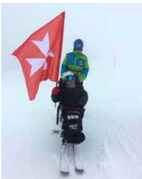
Tutti possono provare l'emozione di una bella discesa sulla neve grazie all'assistenza di Maestri esperti e dedicati!

Grande la soddisfazione nel constatare come an-