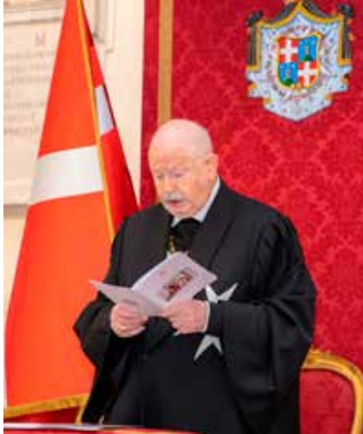
Fra' Giacomo Dalla Torre del Tempio di Sanguinetto, 80esimo Gran Maestro dell'Ordine di Malta.

Obbedienze L'Obbedienza non è una promozione nell'Ordine. È un profondo impegno di vita spirituale e un dovere di maggiore partecipazione alle attività dell'Ordine. E questo non per un periodo, ma fino all'ultimo dei nostri giorni. Non mi stancherò mai di ribadire che i candidati devono essere selezionati con