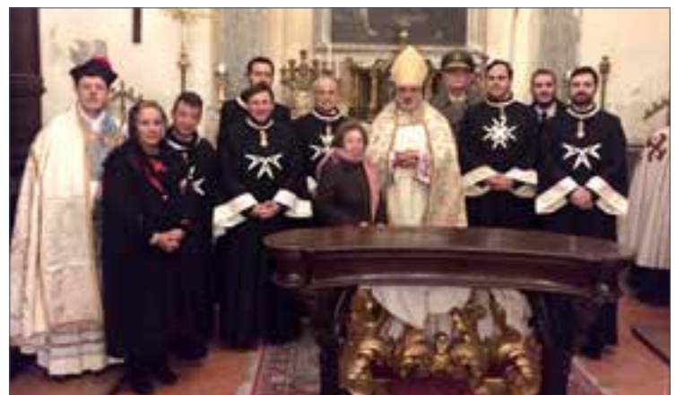
Don Marco Salvi, nuovo Vescovo del capoluogo umbro, con un gruppo di membri dell'Ordine.