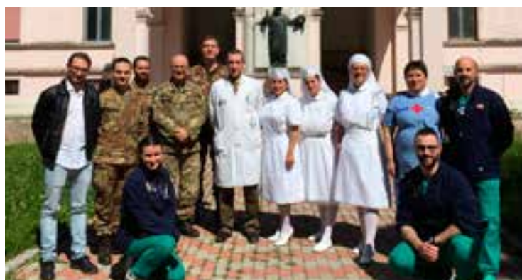
Il gruppo di esperti al termine dei lavori.

S u invito del Centro Ospedaliero Militare di Milano il personale dell'Unità Operativa sul rischio Chimico Biologico Radiologico e Nucleare (CBRN) del Corpo Militare dell'Ordine di Malta, ha partecipato attivamente, il 30 aprile scorso, alla XV Giornata Mondiale contro l'Ipertensione Arteriosa. Scopo di questa iniziativa è stato non solo informare e sensibilizzare la popolazione sul tema dell'ipertensione arteriosa e delle malattie ad essa correlate, che provocano nel nostro Paese oltre 240mila morti ogni anno, ma anche sottolineare l'importanza di una corretta alimentazione per prevenire l'insorgenza di questa patologia. Questo tipo di attività preventiva ha una valenza particolare proprio nel nostro Paese: sebbene le linee-guida dell'Organizzazione Mondiale della Sanità suggeriscano un consumo di sale minore di 5 grammi al giorno, è stato visto come, soprattutto in Italia, l'assunzione di sale nei cibi, calcolando il sodio naturalmente contenuto negli alimenti e il sale aggiunto appositamente per la preparazione o la conservazione delle pietanze, si attesti invece intorno ai 10 grammi quotidiani. (Matteo Guidotti) 🇮🇹