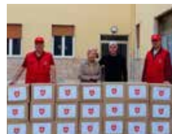
Un momento dello scarico e della consegna delle derrate alimentari.

È per questo che aspettiamo che la meritoria iniziativa venga ripetuta anche per la quinta volta... ❖