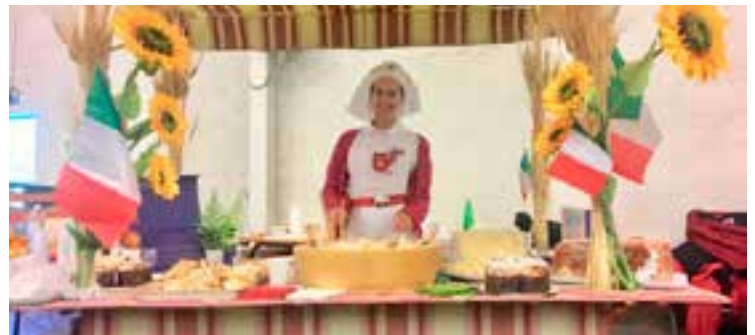
L'affollatissima partecipazione alla serata italiana e uno dei tanti banchetti allestiti dalle Delegazioni italiane per offrire le specialità gastronomiche regionali.