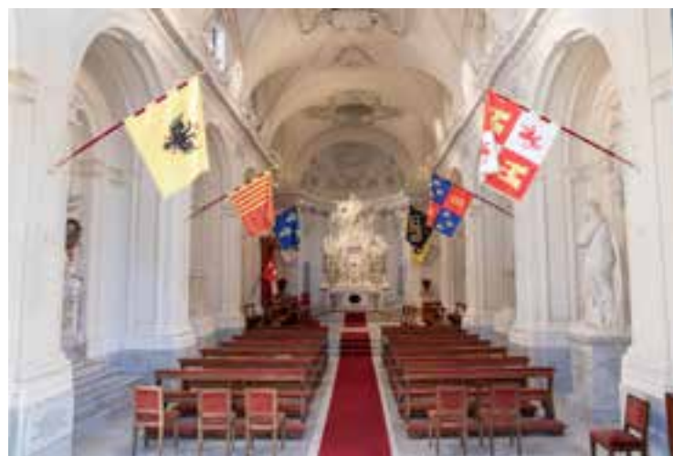
A sinistra, la facciata della Chiesa di Santa Maria del Priorato. Sopra, l'interno con le bandiere delle differenti Lingue dell'Ordine.

Il 18 aprile del 1765, il notaio romano Marcorelli siglò un atto con il quale il reverendo del convento di Santa Sabina concesse al gran priore dell'Ordine di Malta la «parte di un orto per realizzare e costruire la piazza davanti alla nuova chiesa sull'Aventino». Piranesi costruì il portale e le mete dei cavalieri; per ora questa parte non è stata toccata dal restauro ma bisognerà pensarci in futuro. Quello attuato ora da Ferreri e Sabatelli è il terzo maggiore intervento dopo quelli a fine dei moti della Repubblica romana e uno nel Novecento. Nel 2016 le alte cariche dell'Ordine diedero mandato