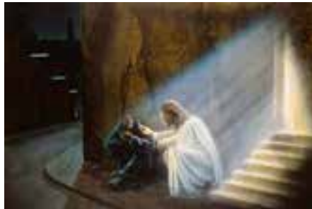
I poveri sono il Corpo di Cristo.

E notiamo che il Vangelo non usa il futuro, ma il presente: il Regno dei