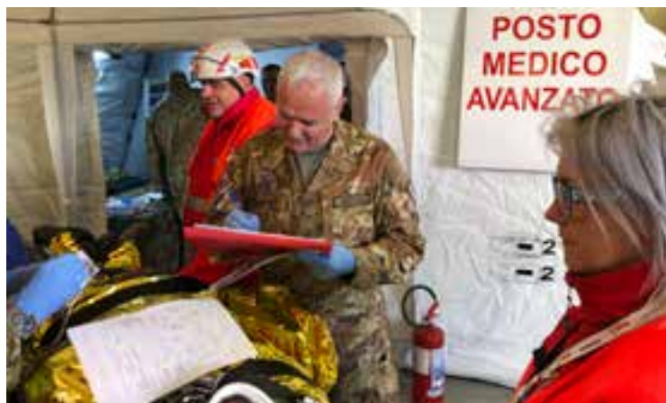
Un momento del test di verifica dei tempi di reattività del PMA.

P er due fine settimana di febbraio, presso il Polo Fieristico di Chiuduno (BG), si è svolta un'esercitazione del Primo Reparto, congiunta con il Nucleo CBRN diretto dal Cap. farm. Massimo Ranghieri. L'obiettivo era di testare alcuni nuovi assetti del Posto Medico Avanzato (PMA) del Reparto, verificandone l'operatività e misurando i tempi di intervento e l'impiego del personale logista all'interno della struttura sanitaria. In particolare, il 23 febbraio si è tenuta l'esercitazione vera e propria nella sua fase dinamica, con la collaborazione dei locali volontari di Croce Rossa, che hanno provveduto a fornire personale aggiuntivo, truccatori e figuranti. La simulazione dell'arrivo quasi contemporaneo di più vittime di incidenti stradali (un'auto investiva un gruppo di ciclisti, evenienza purtroppo tutt'altro che rara), e dell'arrivo di un paziente non accompagnato con sintomi di sospetta febbre emorragica, hanno messo a prova tutto il personale impiegato, che ha potuto lavorare coordinatamente con sincronismo ed efficacia. 🇮🇹