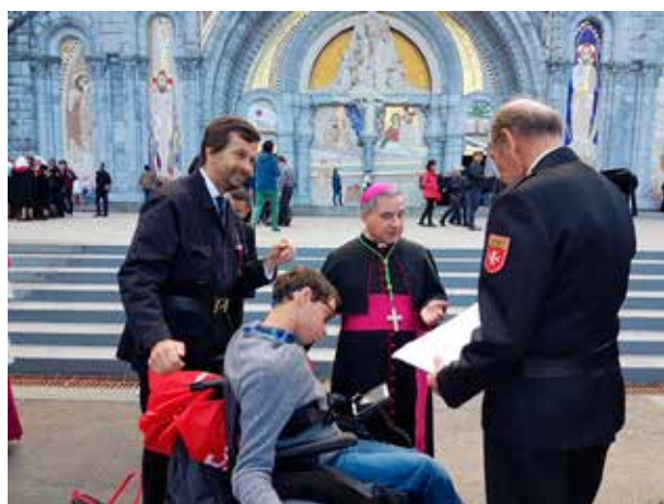
Il Gran Maestro in raccoglimento davanti alla Grotta; la Basilica S. Pio X gremita in ogni ordine di posti durante la Santa Messa Pontificale; la processione "aux flambeaux"; il Delegato speciale del Santo Padre presso l'Ordine di Malta e neo cardinale, Angelo Becciu, con un Signor Ammalato e con l'autore dell'articolo.

tra medici ed infermieri. L'Italia era presente con 1.500 partecipanti, di cui 346 Signori Ammalati, 55 sacerdoti, 65 medici, 13 medici farmacisti, 25 infermieri, 121 accompagnatori, 472 barellieri e 370 sorelle, 10 giovani aiutanti e 20 tra dignitari e ambasciatori.