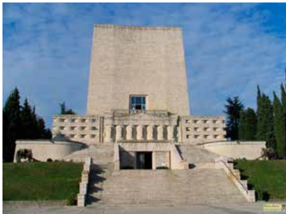
Il Sacrario di Nervesa e le vecchie e sbiadite fotografie trovate dall'autore in una bancarella.

Nel 2008, novantesimo anniversario della fine della grande guerra, il gruppo di Treviso del CISOM, il Corpo italiano di soccorso dell'Ordine di Malta, avviò alcune ricerche. Fu in quell'occasione - sufficiente una telefonata all'Ufficio