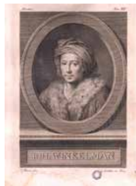
Incisioni dell'epoca raffiguranti il Cardinale Alberigo Archinto e lo studioso Winckelmann.