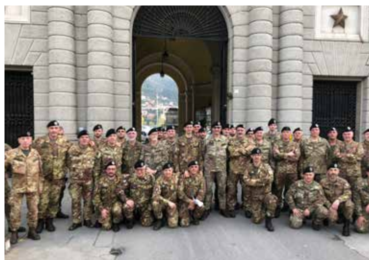
Una simulazione di intervento sanitario d'emergenza e la foto di gruppo dei partecipanti all'esercitazione nella caserma della Marina Militare di La Spezia.

situazioni difficili, delicate ed impegnative. Tutte sono state affrontate e risolte brillantemente, sia sotto il profilo sanitario che logistico, con competenza, efficienza, rapidità e serenità. Siamo già stati gratificati dall'apprezzamento e dal ringraziamento dei locali Responsabili. 🇮🇹