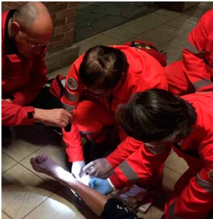
Un gruppo di Unità di Strada in azione per le strade di Milano.

Arriva, finalmente, il giorno atteso: l'uscita con gli altri amici volontari. Per alcuni di noi, il turno inizia ben