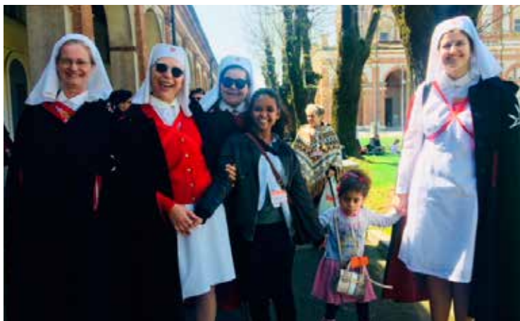
Alcune Dame e Infermiere dell'Ordine con due giovani assistite.

A ltissima adesione per il pellegrinaggio di metà aprile al Santuario di Caravaggio, nella pianura bergamasca occidentale. Da Milano, affiancati dall'ambulanza dell'Ordine di Malta, sono partiti due autobus con a bordo oltre 160 persone, tra cui ben 80 Signori Ammalati e altrettanti tra parenti, accompagnatori, volontari, Dame e Cavalieri dell'Ordine. Altissima è stata l'adesione anche da parte delle altre realtà lombarde dell'Ordine: Brescia, Bergamo, Varese. In tutto più di 200 persone. La scelta di un Pellegrinaggio di un'intera giornata, poche settimane prima di partire per quello più complesso e strutturato di Lourdes, è stata voluta quale segno di particolare attenzione verso i componenti più sofferenti e fragili della nostra comunità: un momento in più di devozione mariana. Una volta giunti al Santuario, i partecipanti sono andati in processione verso la Basilica