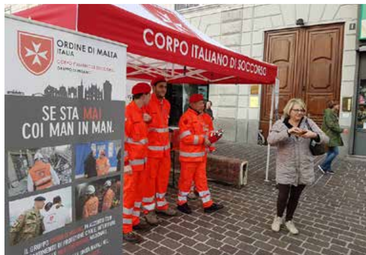
Una tenda dell'Ordine durante una recente manifestazione cittadina.

storia e le caratteristiche del Sovrano Militare Ordine Ospedaliero di San Giovanni di Gerusalemme, detto di Rodi, detto di Malta, più comunemente conosciuto come Ordine di Malta. Si presenteranno con le divise dei diversi corpi e spiegheranno le attività svolte sul territorio, cooperando gli uni con gli altri, e contraddistinti dalla stessa croce ottagonale che simboleggia le otto Beatitudini (Mt 5,3-12) e dallo stesso carisma: Tuitio Fidei et Obsequium Pauperum . Da più di 900 anni l'Ordine di Malta afferma e diffonde le virtù cristiane di carità e fratellanza, esercitando, senza distinzione di religione, di razza, di provenienza e di età, le opere di misericordia verso gli ammalati, i bisognosi e le persone prive di patria. In Italia l'Ordine di Malta è attivo nel campo ospedaliero in ogni