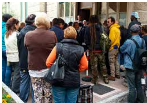
L'ingresso della mensa.

A partire dal 2018, si è iniziato, invece, a registrare gli utenti della mensa e si è così in pos-