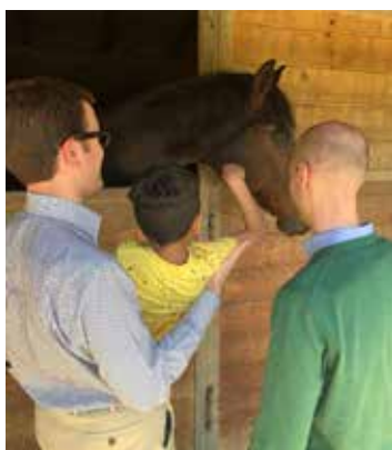
La carezza a un cavallo e un momento dei giochi.

I servizio svolto dal Gruppo Giovanile Beato Gerardo della Delegazione SMOM di Lombardia in favore dei fanciulli del CAF, il Centro Aiuto al Bambino Maltrattato in località Gratosoglio, ha da poco superato i tre anni di attività continuativa. Per celebrare questo traguardo, ma soprattutto con l'obiettivo di rallegrare i bambini assistiti, i volontari hanno organizzato una giornata alla scoperta della campagna lombarda. L'escursione si è incentrata attorno alle tenute della famiglia Gastel, che ha munificamente ospitato tutti per la giornata. I bambini hanno così potuto avvicinare per la prima volta i cavalli, visitare le stalle delle mucche e dei vitelli, nonché ammirare